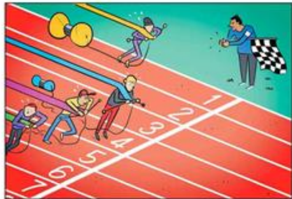
100 METER BREIEN VOOR JONGENS.

Op die manier maken we de schoolperiode voor alle kinderen leuker, laten we kinderen zich beter ontwikkelen, maken we beter gebruik van talenten (leren door doen) en voorkomen we problemen bij het opgroeien.